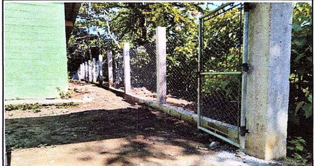
Foto 2: SE CONCLUYE LOS TRABAJOS DE REMOZAMIENTO DEL CERCO O MURO PERIMETRAL